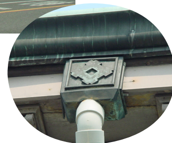
住友の商標が入った雨どい

が設置されたきっかけは、住友化学の変遷の中で、先人の苦勞と喜びを感じたり、住友化学の歩んできた姿を少しでも多くの方々にご理解いただくためです。