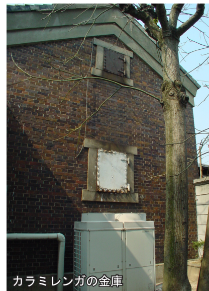
カラミレンガの金庫

現在資料館として利用されている建物は、住友銀行が明治34年(1901)9月に新居浜出張所から新居浜支店に昇格したところに建設されました。その後、昭和33年(1958)1月まで使用されていた由緒ある建物で、一部改修して利用されています。外観だけでなく、カラミレンガづくりの金庫室および書庫が設置されています。建設後100年目を迎えた平成13年(2001)5月15日、最古級の洋館として愛媛県の有形文化財登録されました。