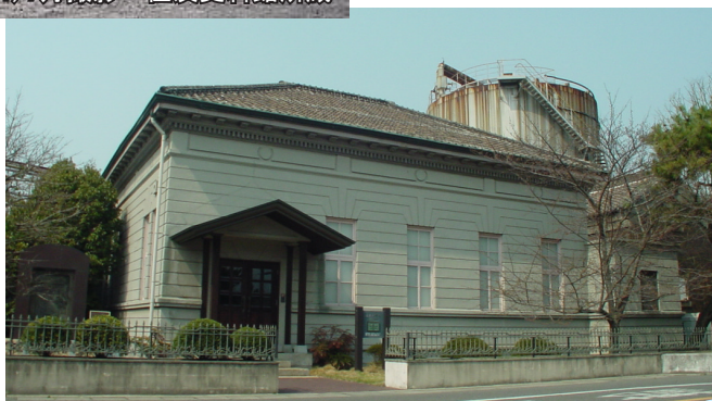
住友化学株式会社愛媛工場歴史資料館

その後、大正14年に株式会社住友肥料製造所として独立し、新しく発足しました。このことが住友化学株式会社の始まりです。