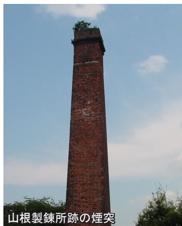
山根製錬所跡の煙突