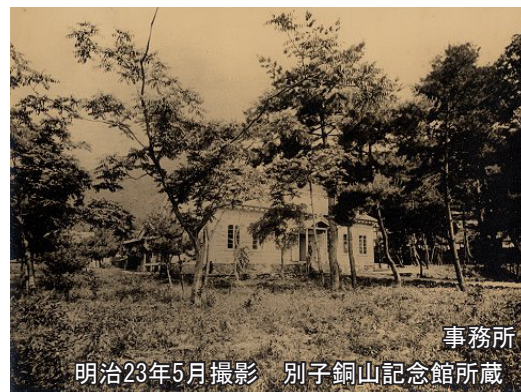
事務所 明治23年5月撮影