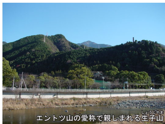
エントツ山の愛称で親しまれる生子山